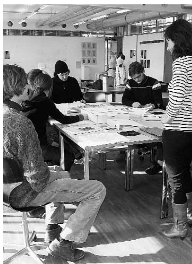
Nach dem Fähigkeitszeugnis die Berufsmaturität.

Die Berufsmaturität schafft also beste Voraussetzungen für eine erfolgreiche be-