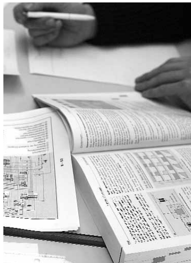
Lernen im Trend: immer mehr junge Leute erwerben die Berufsmaturität.

Theo Ninck, Vorsteher MBA, theo.ninck@erz.be.ch