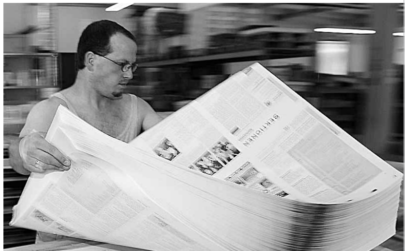
Cinq années d'expérience professionnelle pour obtenir un certificat fédéral de capacité: un façonneur de produits imprimés au travail.

Depuis 2008, un projet-pilote pour opérateurs de médias imprimés (orientation façonnage de produits imprimés) est conduit dans le canton de Berne. Deux